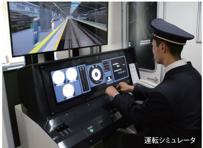
運転シミュレータ