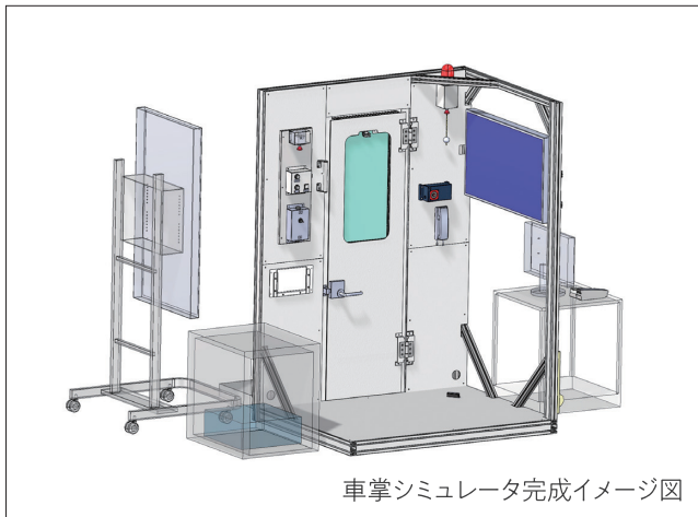
車掌シミュレータ完成イメージ図